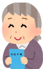
(「高齢者の健康に関する調査」内閣府より)

介護費用に関しては、どの年代を比べても「年金でまかなう」が5割を超える結果でした。介護保険サービスを利用して支払う料金は、年金の範囲の中で、と過半数の方が考えていることがわかります。